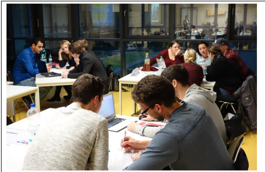
Nochmals nachkalkulieren – ob die Strategie aufgeht?