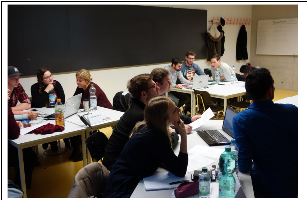
Gespanntes Warten auf die Zwischenergebnisse