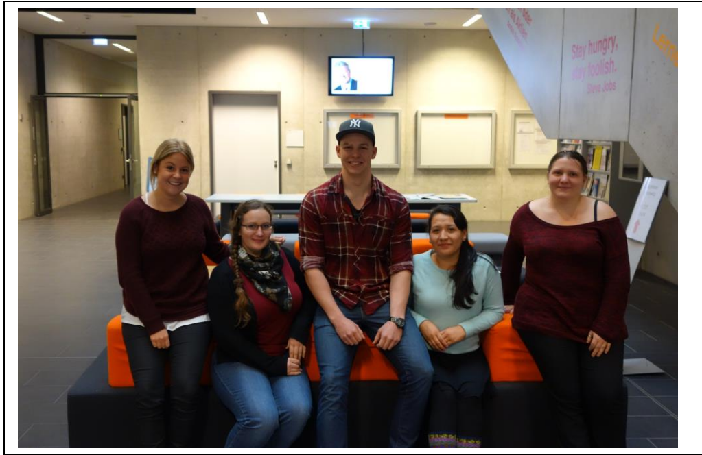
4. Sieger: Surfing Santa