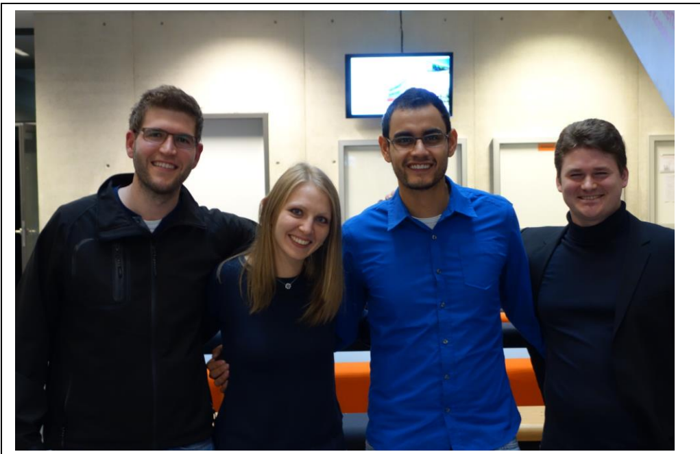
3. Platz: Das Team „Wavers“