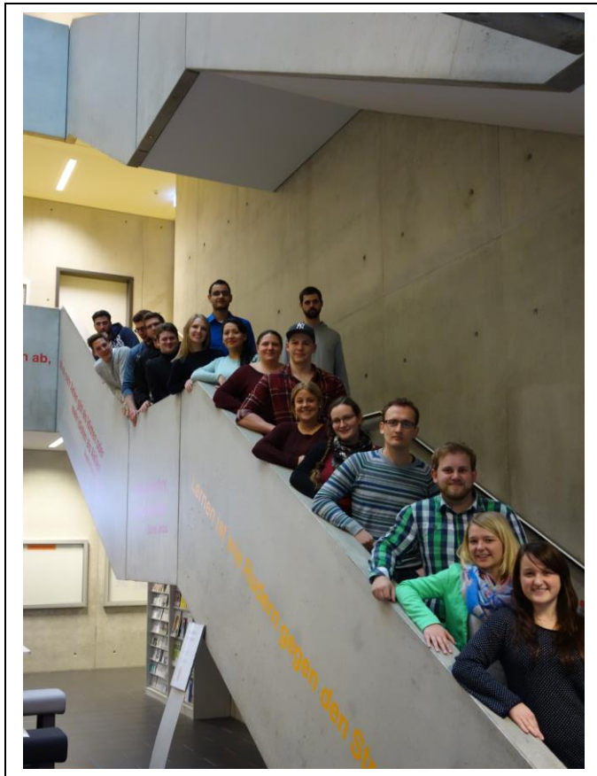
Die Teilnehmer am Campus Cup 2014