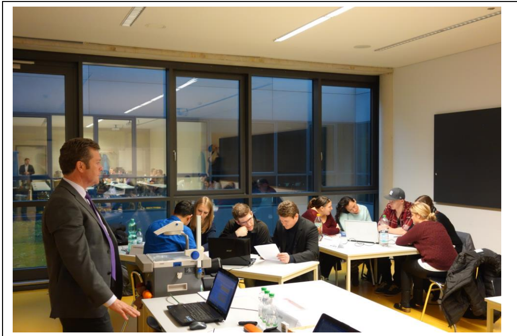
Erwartungsvolle Stimmung - Die Gruppen erhalten Marktinformationen