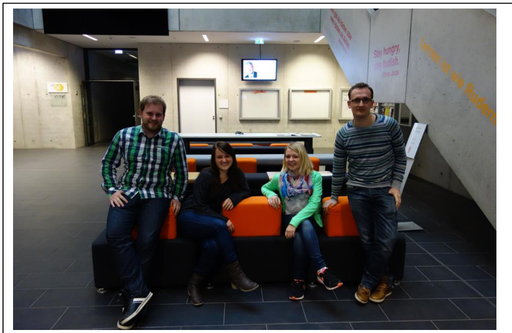
Das Sieger-Team: WaveRider